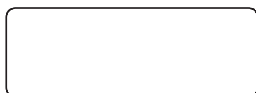
Рис.1 Панель управления

Светодиодные осветители серии StudioLight - это надежные экономичные световые панели с фиксированной цветовой температурой 5500K и DMX управлением. В качестве источников света применены современные сверхъяркие светодиоды с высоким уровнем цветопередачи CRI более 90. Функционально осветители ориентированы на использование в качестве постоянного источника света с управлением по каналам DMX на съемочной или сценической площадках.